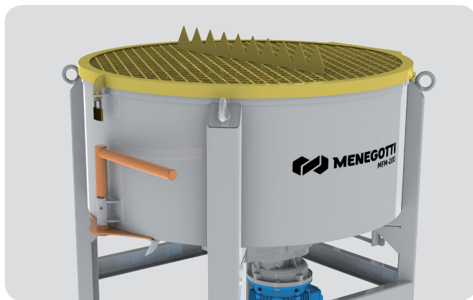
Abertura e fechamento da comporta manual.

Manual opening and closing of discharge gate.