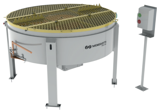
Misturador Forçado MFM 500 Forced-action concrete mixer MFM 500 Mezclador Forzado MFM 500