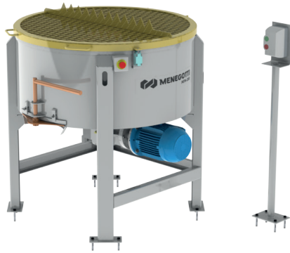
Misturador Forçado MFM 200 Forced-action concrete mixer MFM 200 Mezclador Forzado MFM 200